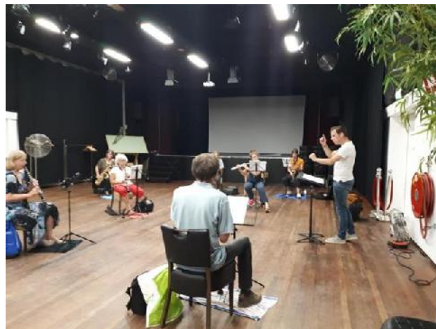
Hier een foto van de eerste repetitie van Da Capo en het SBO .

We zijn er nog lang niet, en hoe we verder gaan met onze concerten en evenementen is nog best een hele puzzel. Maar er klinkt in elk geval weer orkestmuziek bij de KHO.